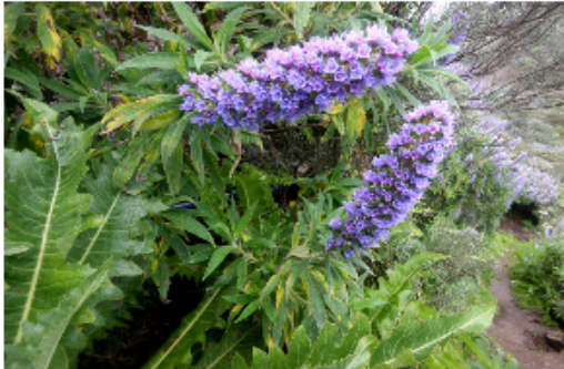
TAJINASTE AZUL (PUNTOS 7)

Beneficio: El niño desarrollará la coordinación óculo manual. Mediante este juego el niño aprenderá a tolerar mejor sus errores e intentarlo nuevamente. Trabajará en grupo y respetará turnos mediante una forma divertida de lanzar.