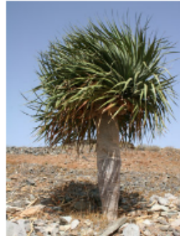
DRAGO CANARIO (PUNTOS 6)