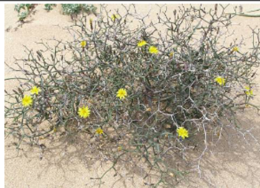
AULAGA (PUNTOS 8)