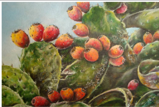
TUNERAS (PUNTOS 3)