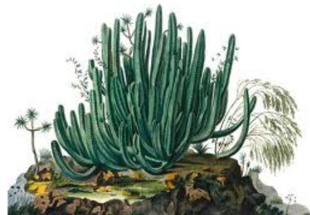
CARDÓN (PUNTOS 4)